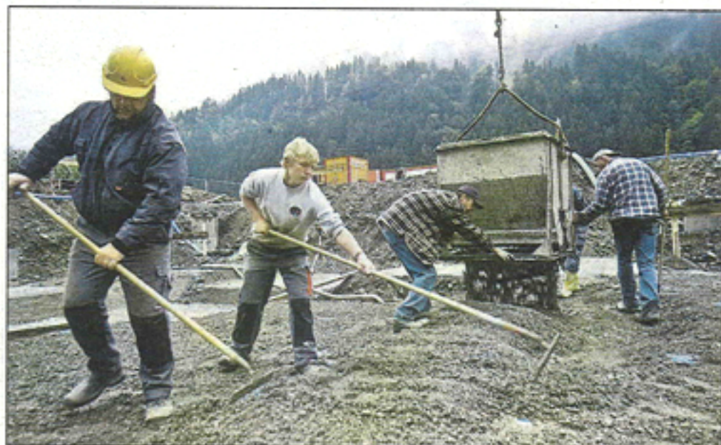
Wichtige Betonierarbeiten beim Naturwärmeheizwerk Montafon haben begonnen.