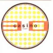
Nicht nur im Jubiläumsjahr engagiert: Casino Bregenz.